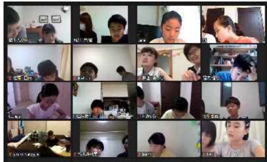
※ライブ映像授業のPC画面。（端末や設定によって見え方が異なります）

新型コロナウイルスへの対処として、令和2年4月からライブ映像授業を採り入れました。校舎での対面授業がベストですが、さまざまな事情で在宅での学習を希望する方のために、『ライブ映像授業』で受講できるようにします。（ご自宅でパソコン・タブレット・スマートフォンにて受講可能です）